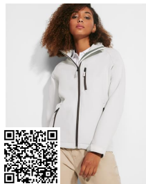
ANTARTIDA WOMAN SS6433