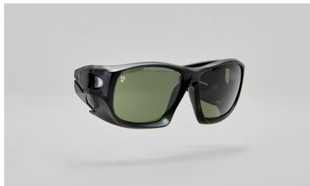
C22 – Montura para lentes de prescripción.