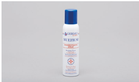
Q409 – Spray desinfectante (150ml).