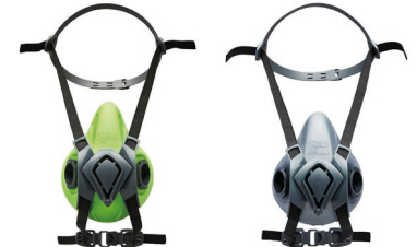
Medias máscaras BLS 4000next S - BLS 4000next R