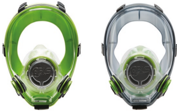
Máscaras completas BLS 5700 - BLS 5600