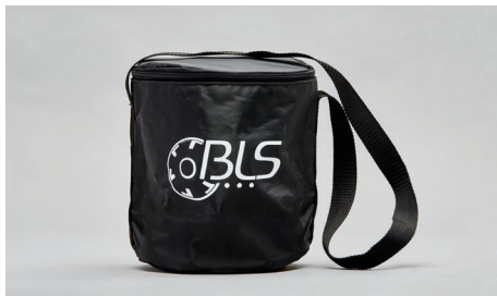
C41 – Bolsa textil para máscaras completas.