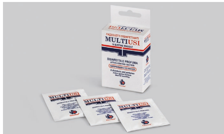
Q409 – Toallitas desinfectantes multiusos.