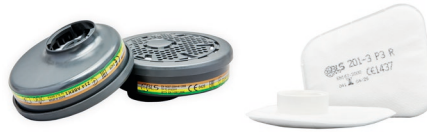
Filtros serie BLS 200